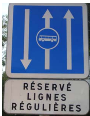
Panneau C24a: Conditions particulières de circulation par voie sur la route suivie.

Les panneaux d'interdiction et les panneaux d'obligation marquent la limite à partir de laquelle les prescriptions qu'ils notifient doivent être observées.